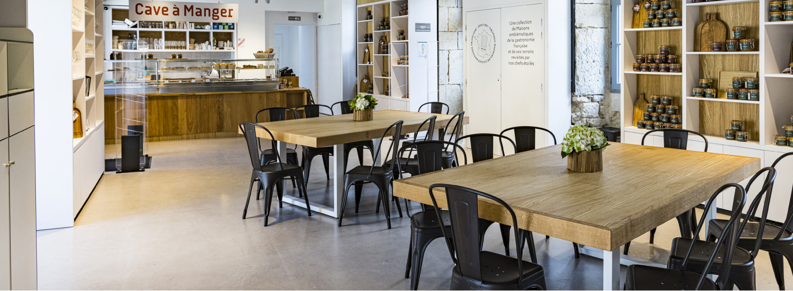
Fabrication et pose d'agencement sur mesure, Cave à manger

Filiale spécialisée dans l'installation générale d'aménagement du bâtiment, IG concept conçoit et réalise vos projets d'installation et d'aménagement.