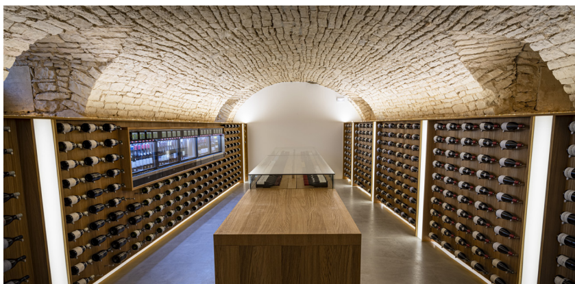
Fabrication et pose d'agencement sur mesure, Cité des vins

Nous fabriquons et posons de l'agencement de qualité, nos menuisiers professionnels travaillent tout type de matière comme le bois, le métal, le verre. Nous trouvons pour vous les solutions de fabrications pour donner vie aux idées des créateurs et dessinateurs.