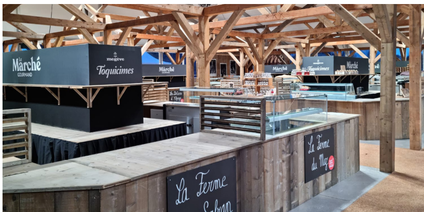
Aménagement et construction des espaces, Toquimes

Nous créons et imaginons pour vous des espaces de caractère, pour personnaliser vos événements. Structures sur mesure pour décors types. Création des espaces, montage de structure fabriquées selon vos idées, sur mesure, décoration, habillage des structures, moquette.