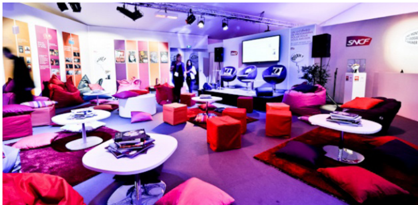
Installation générale et décoration colloque SNCF

Nous nous chargeons de l'installation générale de vos événements et de l'ensemble des installations techniques. Aménagements des espaces stands, des espaces collectifs, commissariat, vestiaires... vélum, distribution électrique, cloisonnement, habillage des cloisons en coton gratté ou tissu imprimés. Prestations sur mesure.