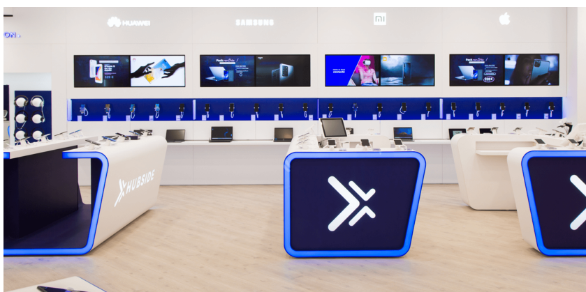
Aménagement sur mesure, Hubsid, Europe

Nous vous soutenons dans votre développement rapide de franchise. Fabrication des comptoirs et éléments et retail en atelier. Pose par notre équipe en boutique en 3 jours en moyenne : montage, installation finition des meubles, éclairage, rangement et enseignes.