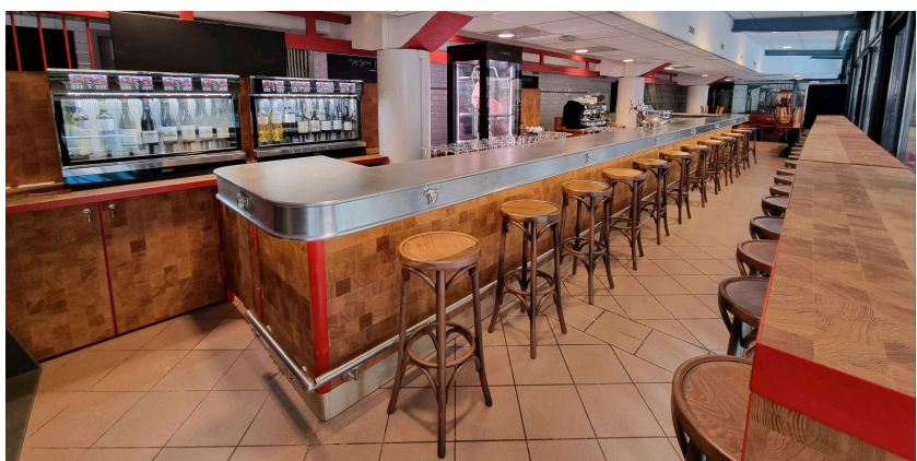
Fabrication et pose d'agencement sur mesure, Maison Louchebem

Le suivi de chantier est le reflet de l'évolution de votre projet. Nos chargés de projet sont à votre disposition tout au long des travaux pour coordonner les interventions et vous rendre compte de l'évolution afin de vous soulager des contraintes techniques.