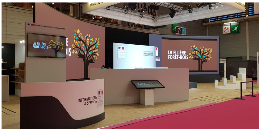
Stand du Ministère de l'Agriculture, salon de l'Agriculture

Création de stand sur mesure, selon vos besoins, nos équipes de créateurs imaginent pour vous des espaces qui vous ressemblent. Dessiner l'espace, révéler des volumes pour mettre en valeur vos message et vos produits. Nos équipes conçoivent, fabriquent en atelier et posent sur vos salons dans un délai imparti en respectant les règlements d'architecture.