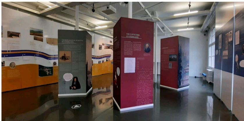
Expo De la Liasse au Pilori, Centre interprétation du patrimoine

Notre service scénographie met en scène, conçoit un parcours en adéquation avec le thème abordé. Création et fabrication de soclage, de mise à distance, de cimaise, mise en couleur, mise en lumière dans le respect des règles de conservation et en dialogue avec les commissaires d'exposition.