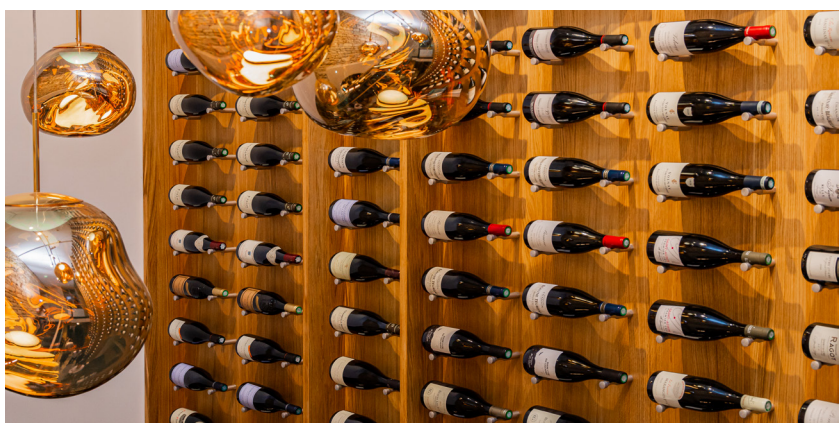
Fabrication et pose d'agencement sur mesure,

Nos équipes de poseurs se déplacent dans toute la France et en Europe afin de maîtriser la pose des éléments fabriqués en atelier sans passer par la sous-traitance garantissant ainsi un travail de qualité maîtrisé.